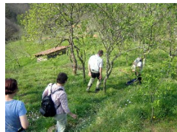
Die neu gepflanzten Bäumchen

Getrocknete und geschälte Kastanien, Vorprodukt des Mehls