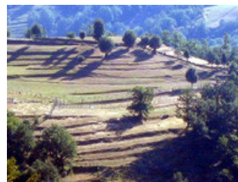
Offene Kulturlandschaft bei Zeri